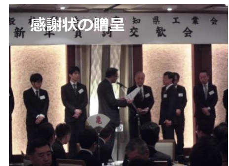
工業会の活動支援としてご寄付 をいただきました (株)技研製作所様に感謝状を贈呈